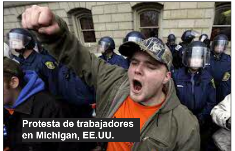
Protesta de trabajadores en Michigan, EE.UU.

Nosotros los trabajadores de MTA tenemos y debemos ingresar al PCOI. Este es nuestro Partido porque representa los intereses de nuestra clase, de lo contrario seguiremos marchando en un callejón sin salida.