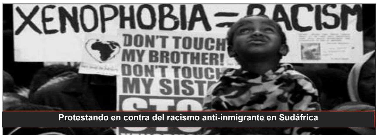
Protestando en contra del racismo anti-inmigrante en Sudáfrica

casez pero será resuelta colectivamente; compartiremos lo que tengamos. Nadie será golpeado o asesinado por tener hambre. Sabemos que tenemos una gran tarea en nuestras manos pero nuestro Partido aquí es muy nuevo, estamos aprendiendo. Nunca nos daremos por vencidos. Estamos usando Bandera Roja como nuestra herramienta revolucionaria para construir nuestro Partido. Tenemos mucha energía y pasión para el comunismo y estamos convencidos de que el comunismo es la única solución a nuestros problemas.