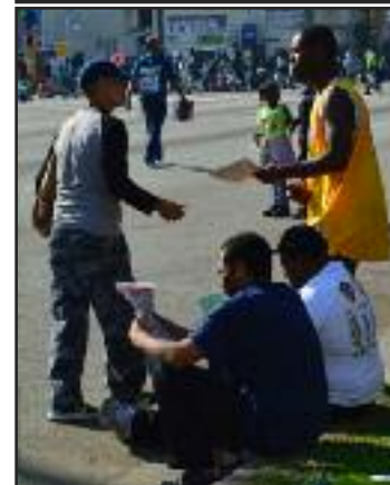
Distribuyendo Bandera Roja en la marcha de Martin Luther King