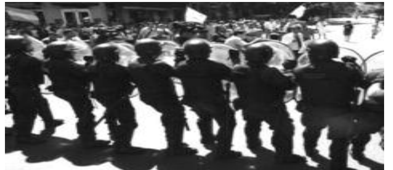
Argentina, febrero-2012--Policías atacan a veteranos del ejército que reclaman sus beneficios de pensiones

La guerra por la cual vale la pena luchar es la que destruya a los patrones y su sistema de ganancias, la guerra para construir un sistema comunista donde vamos a producir y luchar solamente para satisfacer las necesidades de nuestra clase.