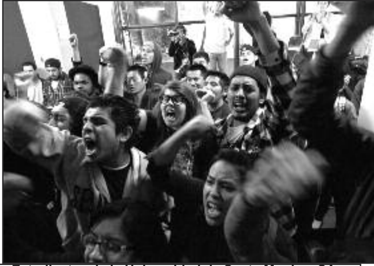
Estudiantes de la Universidad de Santa Monica, CA.

profesor habló del “valor de la educación pública para una nación próspera y democrática”, añadiendo, que “necesitamos encontrar las mejores ideas para enfrentar esta crisis y fortalecer nuestro sistema.”