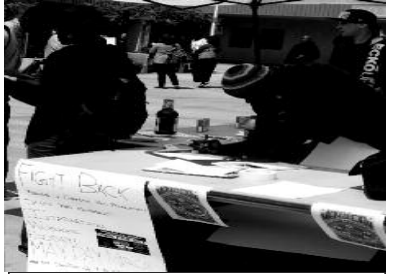
27de marzo--Estudiantes firman carta de apoyo a familias de victimas de asesinatos racistas y tomando copias de Bandera Roja y calcamionias del 1º de mayo

El estibador leyó en voz alta una carta a Bandera Roja de un trabajador de Boeing acerca de la lucha en la planta en torno a Trayvon Martin. Describe en parte como movilizaríamos a las