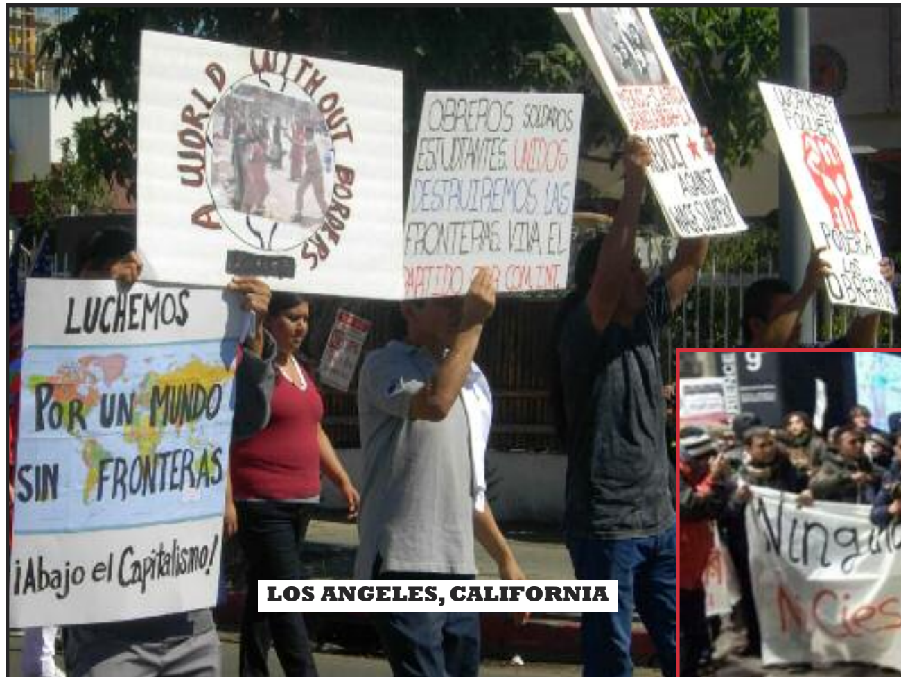
LOS ANGELES, CALIFORNIA