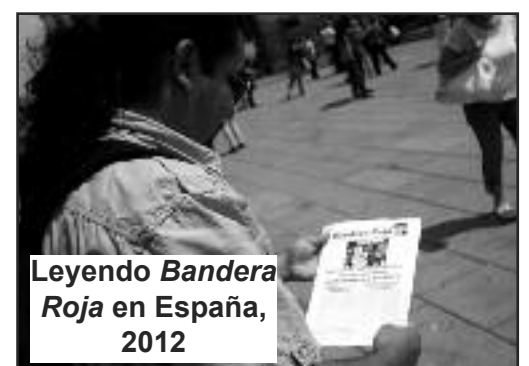
Leyendo Bandera Roja en España, 2012

comunismo y esa es la verdadera lucha a la que tenemos que enfrentarnos durante nuestra vida. La Revolución Comunista liderada por el PCOI es la única alternativa para mejorar la calidad de vida de toda la clase obrera, y el PCOI somos todos, llegaremos hasta donde queremos mientras luchemos por derrotar al capitalismo. Este 1ro de Mayo saldremos nuevamente a las calles a reivindicar todas estas ideas, saldremos a las calles a encontrarnos con nuestros hermanos trabajadores, les llevaremos Bandera Roja y discutiremos temas políticos que nos ayudaran a entender qué es el Comunismo y cómo funciona. ¡VIVA LA CLASE OBRERA! ¡VIVA EL PCOI!