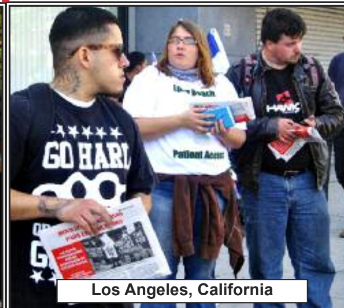
Los Angeles, California