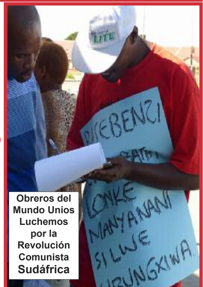
Obreros del Mundo Unios Luchemos por la Revolución Comunista Sudáfrica