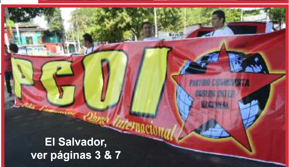
El Salvador, ver páginas 3 & 7

REBELIÓN EN BALTIMORE DEMUESTRA POTENCIAL REVOLUCIONARIO PÁGINA 2 & 8