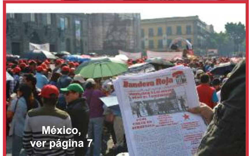
México, ver página 7