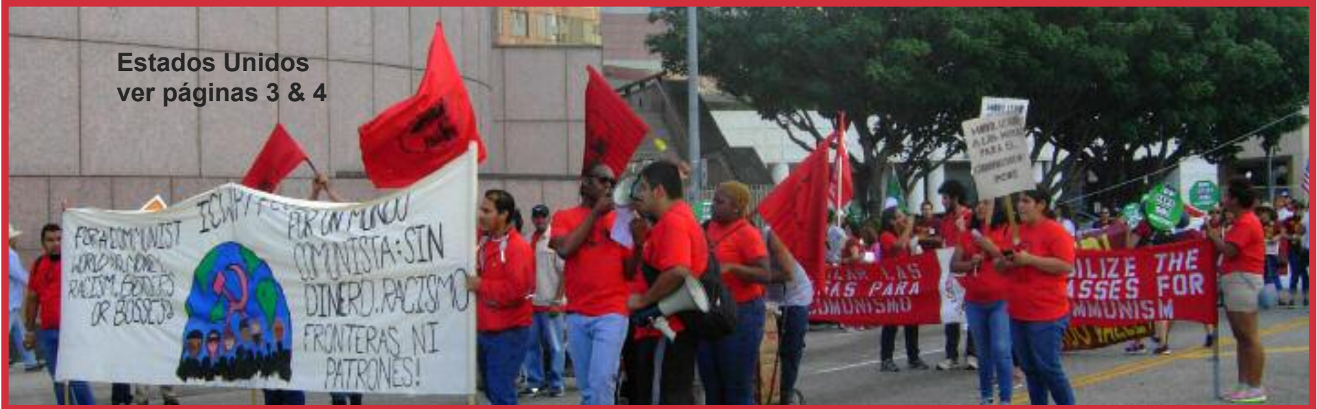
Estados Unidos ver páginas 3 & 4

PARTIDO COMUNISTA OBRERO INTERNACIONAL * WWW.ICWPREDFLAG.ORG