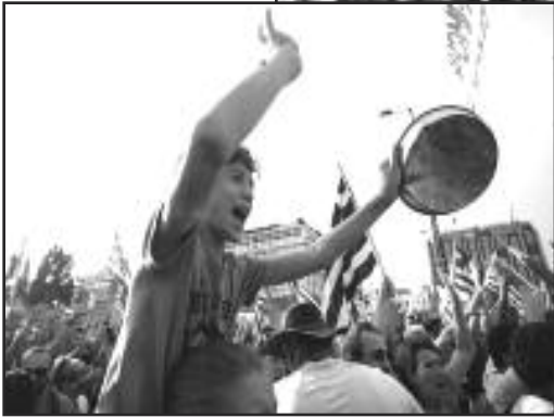
Atenas, Grecia, 5 de junio del 2011--Ochenta mil trabajadores y estudiantes protestan programas de austeridad impuestos por Eurozone y FMI. Ver página 6.