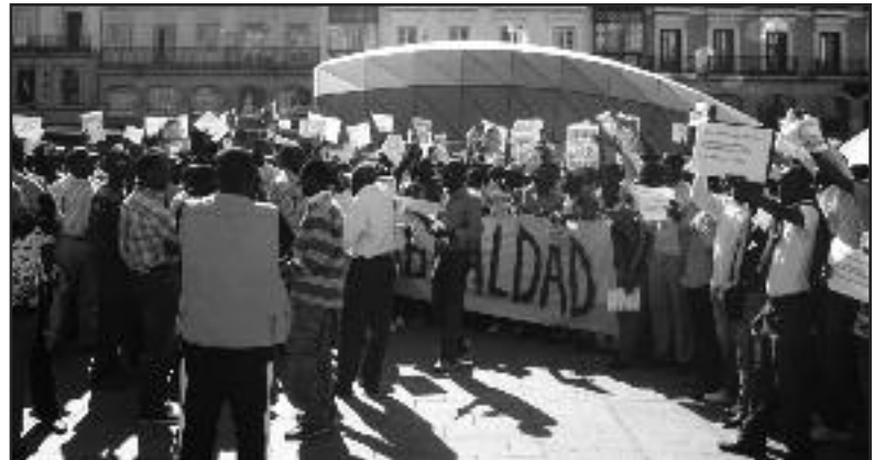
Trabajadores africanos protestan en España, 2009

Público o privado—las compañías existen para hacer ganancias a expensas del trabajo de los obreros y sus vidas. Ninguna reforma terminará con esto. Necesitamos construir la lucha por la revolución comunista. En un mundo comunista toda la producción y servicios estarán en las manos de la clase trabajadora, no en capitalistas privados o el estado capitalista; estos ya no existirán. El estado obrero a través de su partido, PCOI, garantizará la distribución de acuerdo a las necesidades; todos los trabajadores harán trabajo vital y darán liderazgo en construir la sociedad comunista. A formar Conciencia de Clase, Únete al PCOI!