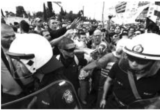
Grecia, Huelga General, junio del 2011

Todos ellos—y los patronos griegos— están de acuerdo en que los que más perderán serán los trabajadores griegos. Los trabajadores de otros países europeos también pagarán impuestos mucho más altos para financiar cualquier rescate que se acuerde.