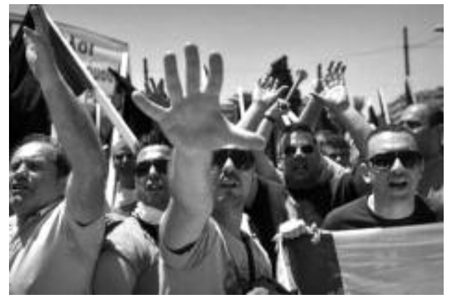
Grecia, Estibadores en huelga, junio 2011

Piraeus, junto a la compra de ferrocarriles y los vacíos estadios olímpicos de Grecia, han ayudado a China a expandir y consolidar un gran comercio con Europa. Un diario importante de Holanda llamó a Grecia la primera colonia china en Europa. Los patronos chinos también ven a Grecia como punto de entrada al Norte de África y el Medio Oriente, desafiando directamente los intereses de EEUU. Según un oficial del gobierno de China, “Europa es dos cosas, un gran mercado para las exportaciones chinas con muchas oportunidades para la ‘explotación’, como también un “seguro” en caso de que los mercados de EEUU colapsen”. El primer ministro de Grecia dijo, “Los chinos quieren una entrada a Europa... ellos no son como los cabrones de Wall Street, que hacen inversiones financieras en puro papel. Los negocios con los chinos son reales, son en mercancías. Y ellos ayudarán a la economía real de Grecia”.