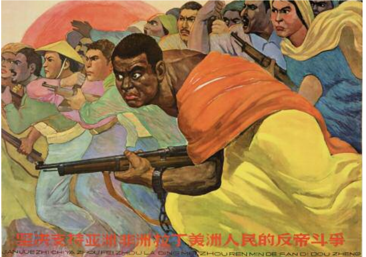
Póster chino, 1964: “Opoyo firme a la lucha anti-imperialista de los pueblos en Asia, África y Latino América”.

El año pasado, 230 obreros de la construcción de Mozambique se declararon en huelga en protesta por las palizas de parte de sus empleadores chinos y las pésimas condiciones de trabajo.