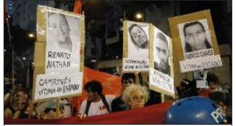
Protesta, Brasil, marzo 2014

El comunismo es una sociedad basada satisfacer las necesidades obreras. Cada persona será animada a construir la nueva sociedad de acuerdo a su capacidad. Cientos de millones de obreros