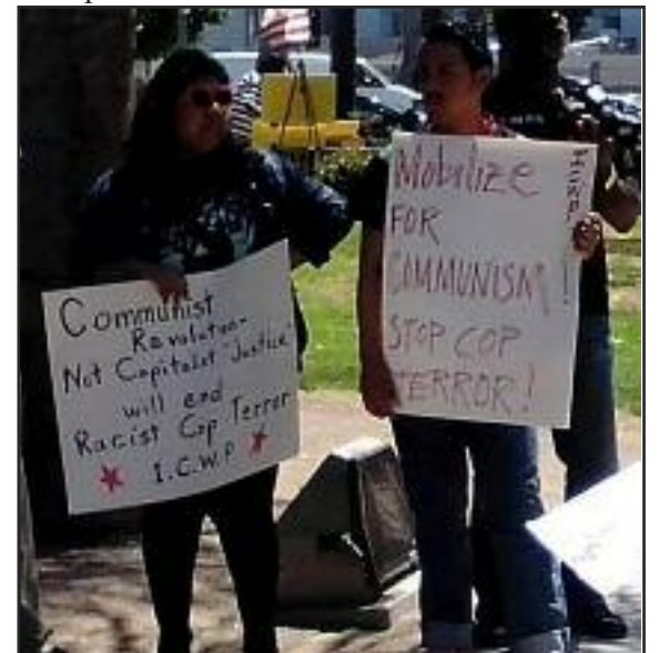
Jóvenes rojos llevan ideas comunistas a las protestas en contra de policías racistas y asesinos.

No debemos caer víctima de la ideología capitalista que les dice a jóvenes negros y latinos que rechacen a clase obrera y a sus padres obreros, que la universidad es el escape, y que deben luchar por la ilusión del éxito capitalista. Debemos luchar contra el racismo que los patrones usan para dividir nuestra clase y por construir un movimiento que movilice a las masas para el comunismo. Las vidas de todos los trabajadores son importantes, independientemente de su color. Esto sólo será realidad en una sociedad comunista donde la división entre el trabajo intelectual y manual será abolido junto con la dominación de clase, y donde podamos trabajar juntos para producir lo que necesitamos, sin policías ni patrones ni dinero.