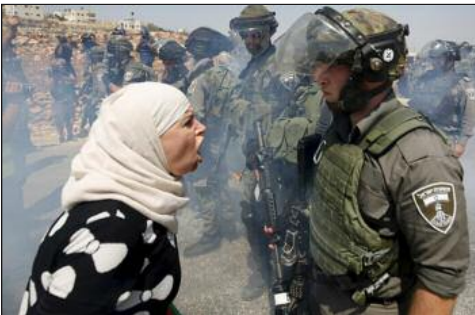
Una mujer palestina confronta soldado israelí

En contraste con el capitalismo racista, el comunismo verdadero satisface las necesidades de todos “según la necesidad de cada cual”. Movilizando a las masas para el comunismo significará una lucha sistemática contra las prácticas e ideas racistas establecidas por mucho tiempo. Esa lucha comienza ahora.