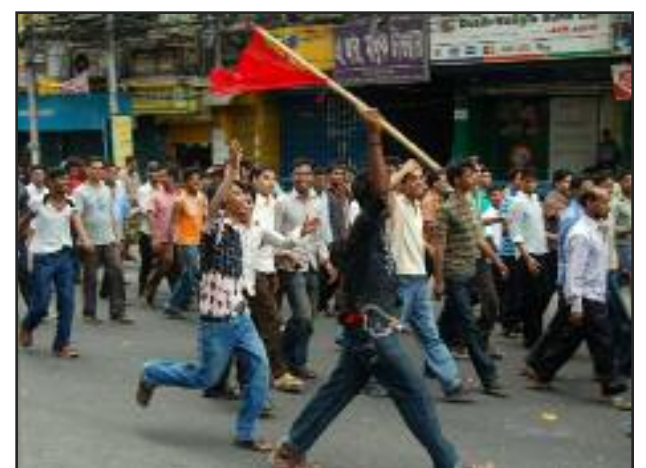
Trabajadores de la costura en Banglades, 1 o de mayo del 2010

Invitamos a los trabajadores del mundo que reciben Bandera Roja que formen círculos de estudio y acción en torno a Bandera Roja . Les invitamos a que organicen redes de distribución del periódico, que escriban y reporten sus luchas y se esfuercen por movilizar a las masas obreras para el comunismo. Al final, el trabajador reclamó, “¡Podemos lograrlo!”