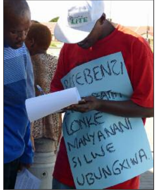
Sudáfrica, en idioma Xoxa dice “Obreros del Mundo Unidos por el Comunismo”

Las sanciones impuestas por la ONU a Zimbabwe convirtieron a Sudáfrica en el principal productor de recursos minerales en la región meridional de África. Mnangagwa promete una transformación que creará oportunidades de empleo, pero en realidad, más empleos significan que más trabajadores serán explotados. Este cambio de gobierno es una amenaza para a los dueños de las minas sudafricanas o una expansión de su