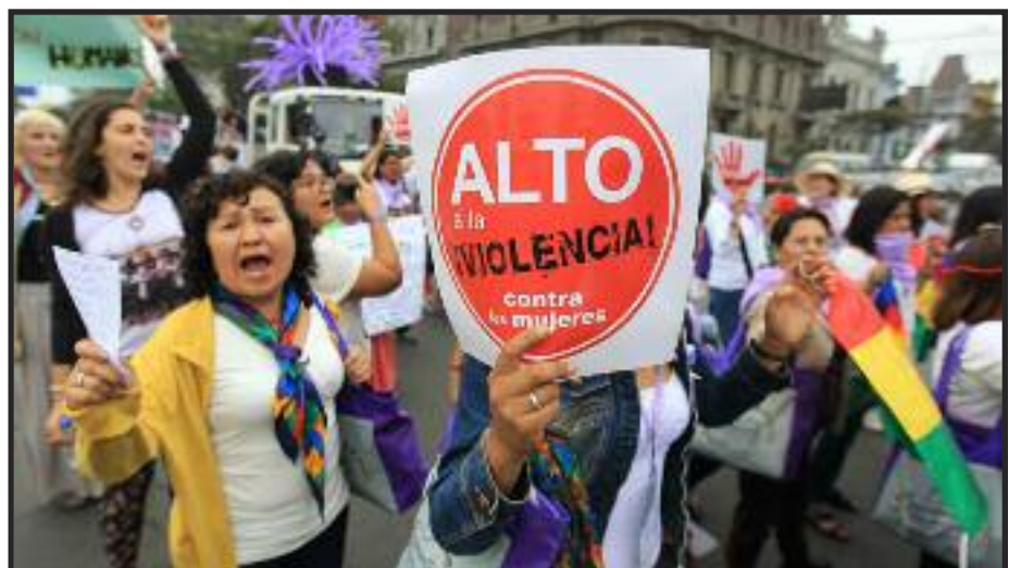
LIMA, PERÚ, 27 de noviembre—Día de protesta Internacional en contra de la violencia a las mujeres.