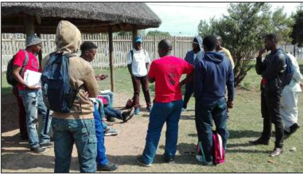
Jóvenes en Sudáfrica discutiendo las ideas comunistas del PCOI

¿Cómo participamos entonces en tales eventos sin contradecirnos como revolucionarios? Decimos que queremos una sociedad comunista donde el modo de producir y distribuir será completamente diferente del modo capitalista basado en la explotación. Incluso la forma en que organicemos nuestras vidas será diferente. Se basará en la cooperación y el esfuerzo colectivo. ¿Cómo vivimos entonces hoy día o en el futuro inmediato, forjando y ejecutando prácticas que estén de acuerdo con nuestros principios comunistas? Porque las ideas comunistas deben practicarse y mejorarse, pero ¿cómo hacemos esto y nos solidarizamos al mismo tiempo con las masas sin caer en la trampa reformista?