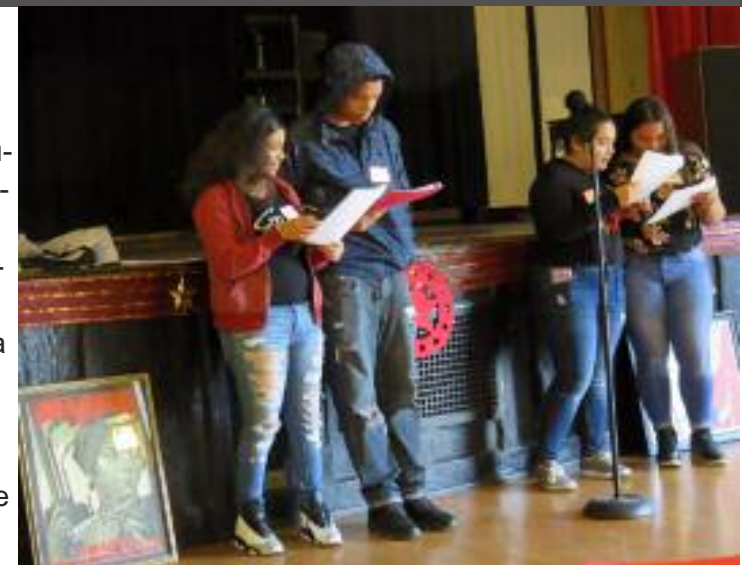
Estudiantes de bachillerato leyendo el poema “Buenos Días Revolución” durante la celebración de la Revolución Rusa en Los Angeles, USA

El día de la celebración me encantó mucho porque es importante celebrar las fechas que han marcado la historia de los pobres, de todas las personas trabajadoras. Aprendí mucho. El comunismo es importante porque todos estare-