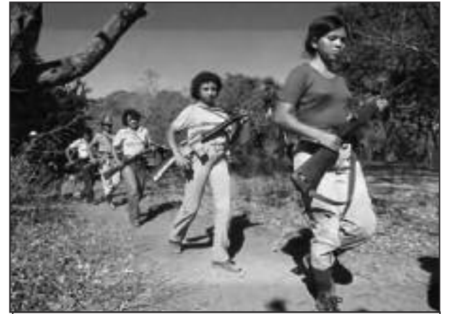
Guerrilleras, El Salvador

Trabajadoras textiles en New Bedford, Massachusetts, USA, 1928