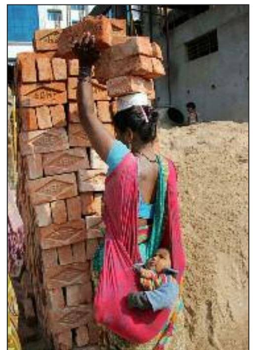
Mujer trabajadora de la India