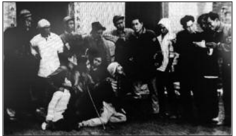
El grupo dramático de las Montañas Taihang poniendo en escena la obra “Odio de Sangre y Lágrimas”

El Partido no descuidó las formas más ambiciosas del teatro. Tuvieron mucho éxito en adoptar el formato de la ópera tradicional china para piezas como el “Destacamento Rojo de Mujeres”