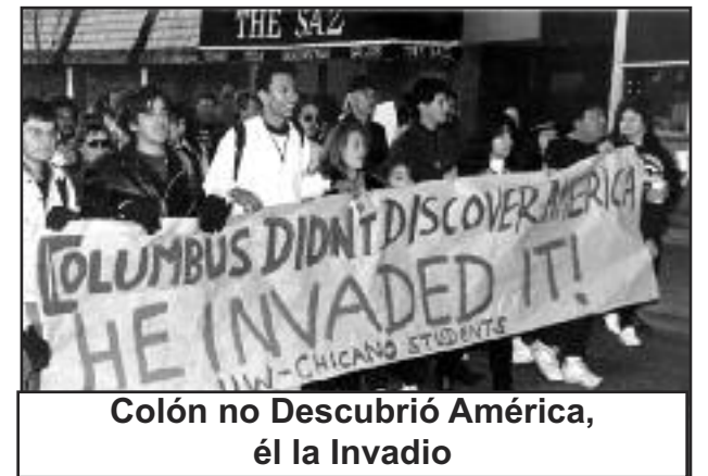
Colón no Descubrió América, él la Invadío

La educación comunista de las masas debe comenzar ahora. No se dará en las escuelas y universidades capitalistas, las cuales deben ser destruidas. Se dará mediante la distribución masiva de nuestra literatura comunista, leyendo y es-