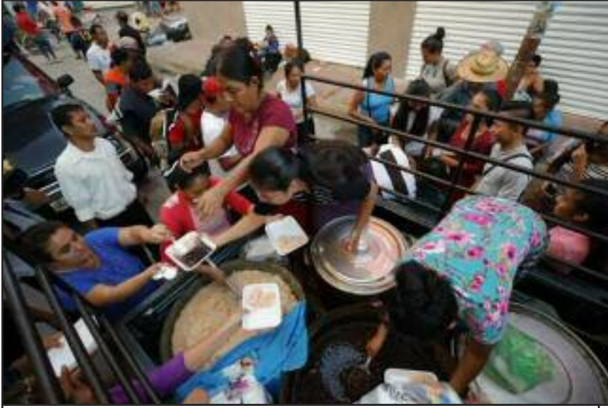
Mujeres Obreras mexicanas se solidarizan con caravana de inmigrantes centroamericanos

Este es el periódico de la clase trabajadora. Obviamente no recibimos ayuda económica de los capitalistas, sus fundaciones ó ONG's. Por favor colabore generosamente para ayudar a cubrir los costos de producción y distribución.