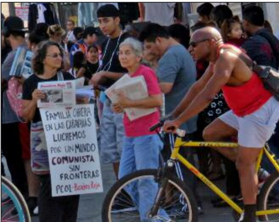
Distribuyendo Bandera Roja en Los Angeles, en favor de la caravana el 27 de octubre, 1968

¡Únetenos en Movilizar a las Masas para el Comunismo! www.icwpredflag.org USA (310)-913- 9704