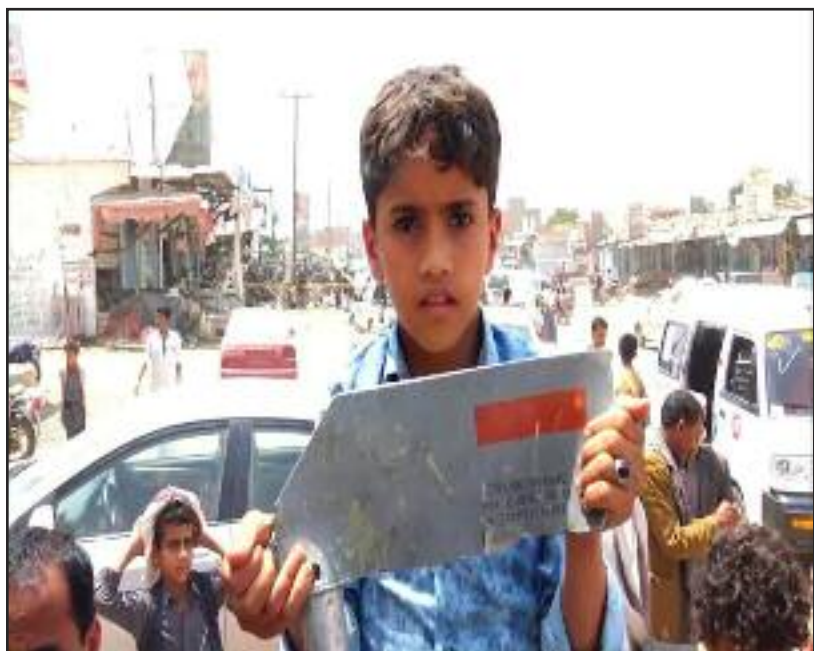
Un niño carga un fragmento de una bomba MK-82 hecha por US-Lockheed Martin usada en el bombardeo de un bus lleno de niños escolares en Yemen.

El PCOI debe crecer en todo el mundo. Solo una clase obrera comunista que se moviliza para el comunismo puede erradicar las masacres masivas de los gobernantes. Obreros, soldados y jóvenes como tú necesitan ingresar al PCOI. Juntos convertiremos las crisis y guerras de los capitalistas-imperialistas en una lucha para enterrar su sistema mortal para siempre. Juntos construiremos el mundo comunista que necesitamos y merecemos.