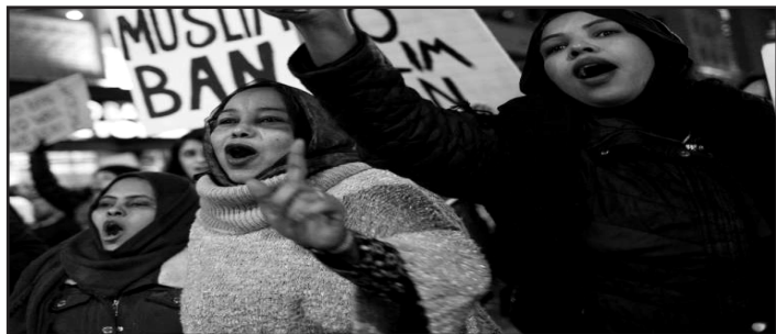
Estados Unidos, 2018. Protestas contra la Iniciativa de Prohibición de Viajes a Musulmanes

Todo comienza con los colectivos del Partido. Se debe dar prioridad al reclu-