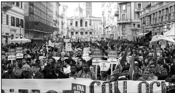
Roma, Italia, noviembre 2018: Veinte mil se manifiestan contra la ley antiinmigrante.