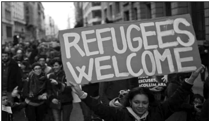
Barcelona, España: Decenas de miles se manifiestan en apoyo a los migrantes.