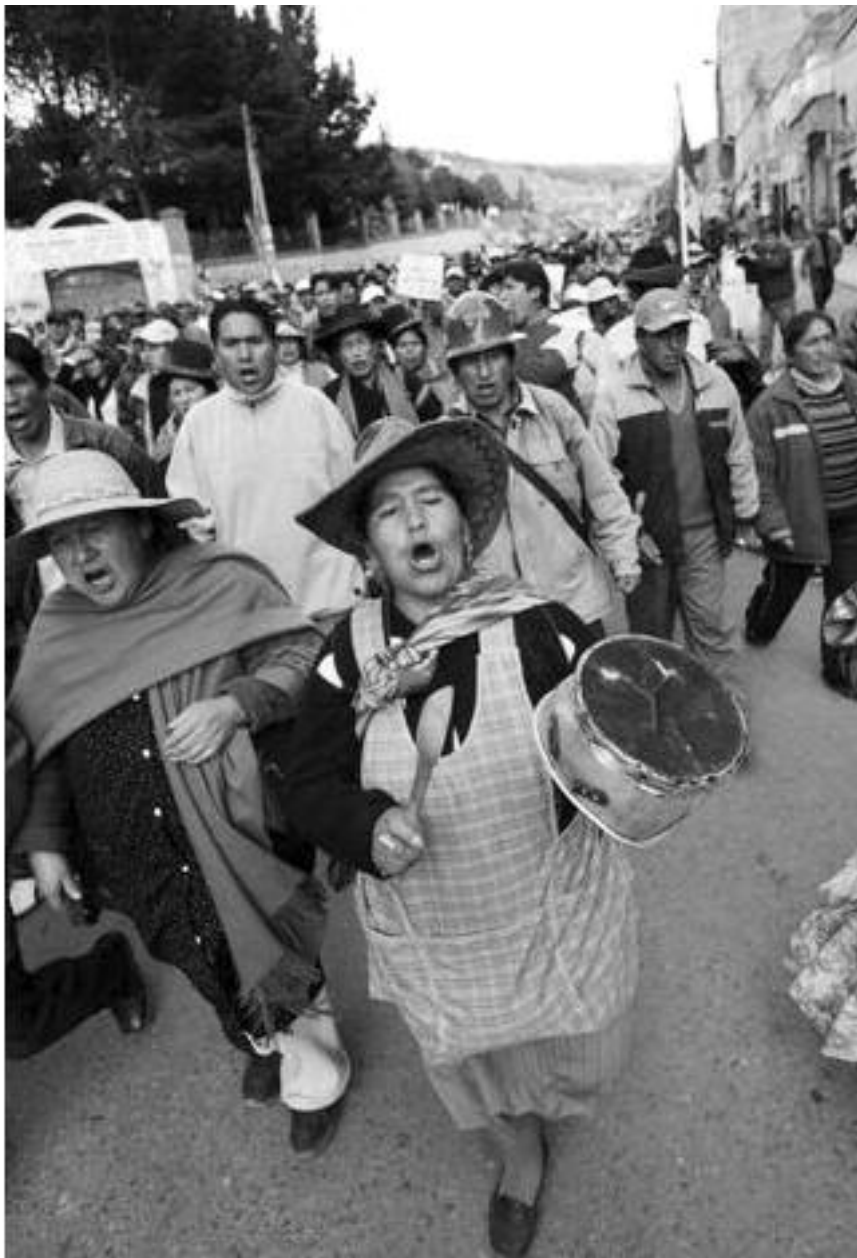
Trabajadores en Bolivia protestan contra el incremento de los precios de la gasolina del 82%, impuesto por el Presidente Evo Morales

PERIODICO DEL PARTIDO COMUNISTA OBRERO INTERNACIONAL * WWW.ICWPREDFLAG.ORG