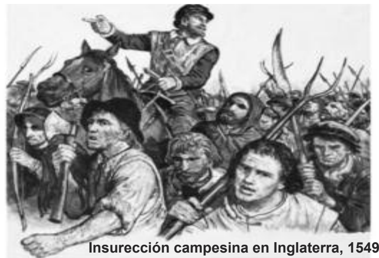
Insurrección campesina en Inglaterra, 1549

Las masas trabajadoras movilizadas para el comunismo librarán las últimas guerras de necesidad: las guerras para destruir a los patrones y su aparato estatal y establecer el comunismo mundialmente. Entonces ya no habrá mas guerras por el excedente que producimos, el cual solo servirá las necesidades de la clase obrera internacional. Crearemos las bases materiales e ideológicas para eliminar totalmente las clases y erradicar las ideologías ponzoñosas – racismo, sexismo, nacionalismo, religión, individualismo, cianismo – que se han usado para esclavizarnos.