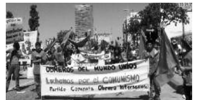
Los Angeles, Jóvenes del PCOI, marchan 1 de mayo, 2010

¡Felicitamos y agradecemos a todos nuestros amigos, lectores y distribuidores de Bandera Roja, y camaradas por su dedicación y esfuerzos por construir el Partido Comunista Obrero Internacional! ¡Multipliquemos nuestros esfuerzos en el 2011!