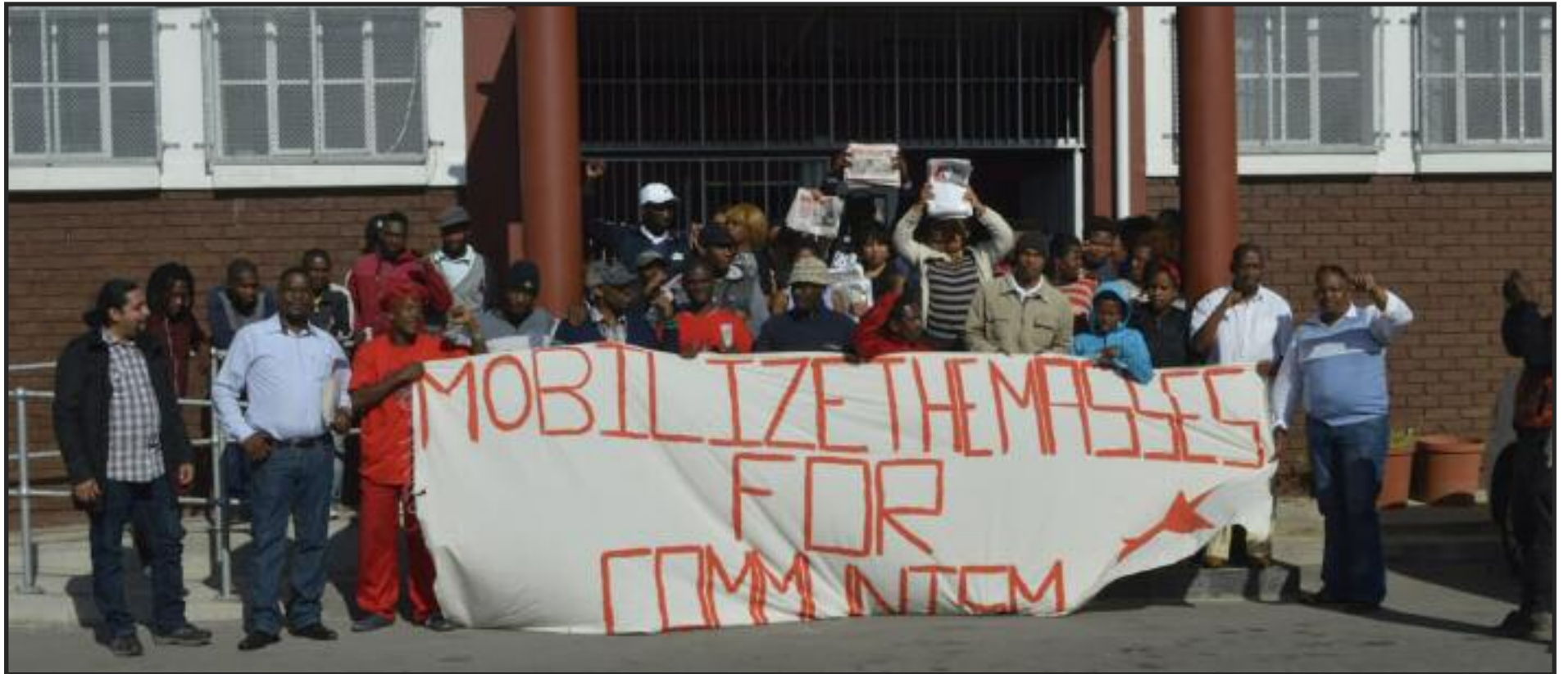
CONFERENCIA COMUNISTA EN SUDÁFRICA, NOVIEMBRE DEL 2015 CONSTRUYENDO EL PCOI EN SUDÁFRICA, VER PÁG 3