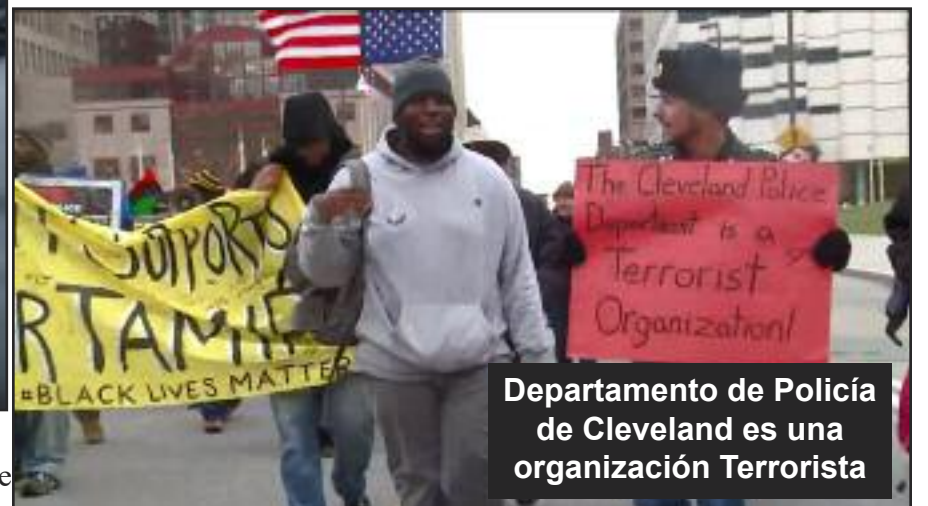
Departamento de Policía de Cleveland es una organización Terrorista

Desde 2006 el FBI advirtió que fascistas del Ku Klux Klan y los Nazis estaban organizando dentro de los principales departamentos policiales, incluyendo Chicago, Cleveland y Los Ángeles. Esto muestra que los gobernantes capitalistas de EE.UU. están intencionadamente desatando este terror racista. Es un ataque contra toda la clase obrera. Su objetivo es asustarnos para que seamos sumisos. ¡No lo logran!