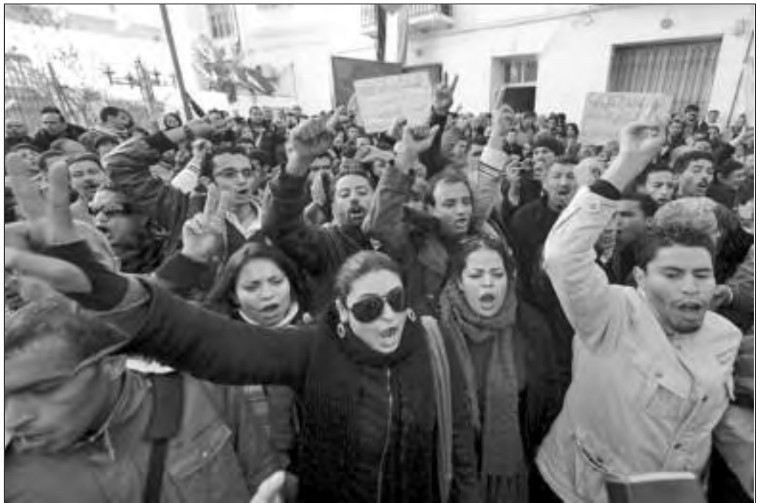
Túnez--Estudiantes y graduados desempleados dan liderato a lucha contra condiciones fascistas.

Treinta años en el trabajo y los patrones todavía con tacañerías: