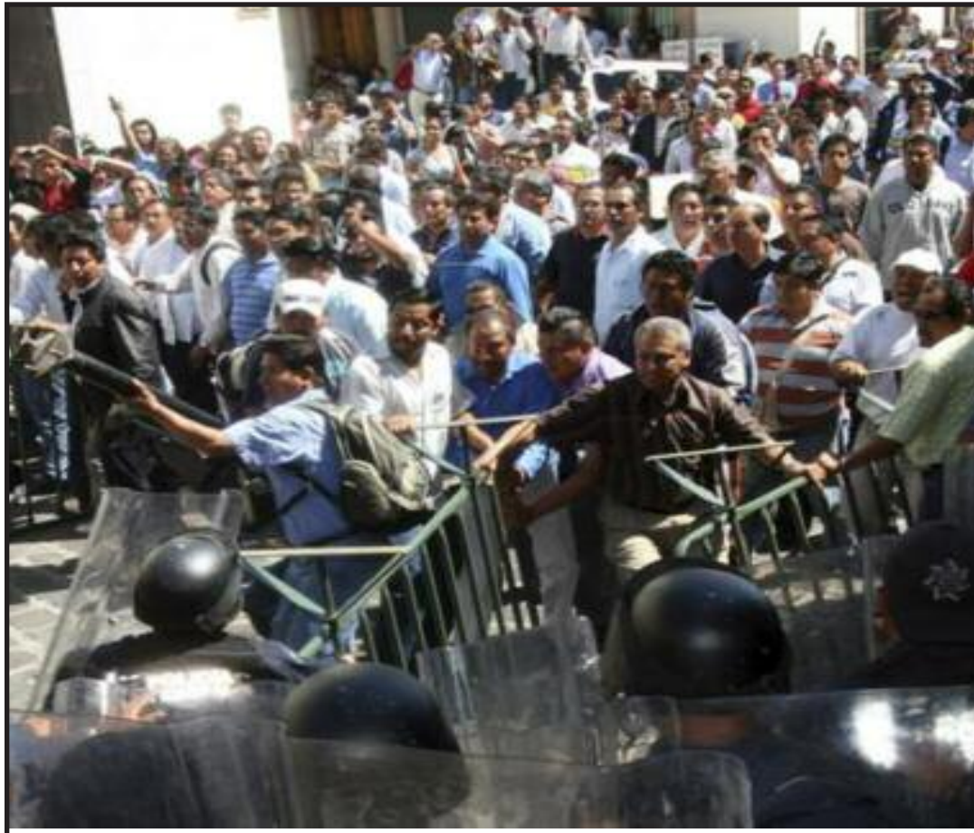
Maestros en Oaxaca en febrero del 2011 luchando contra la policía, durante la huelga en contra de la reestructuración capitalista en las escuelas.

mundo diferente, un mundo comunista. La tarea de una nueva forma de educar es una lucha propia de la clase obrera en una nueva sociedad comunista. En tu carta has expresado que se debe hacer la revolución de una forma pacífica, sin armas. Creemos que esto no puede ser posible ya que los patrones no dejarán de una forma pacífica el mundo que debemos de ganar. La historia nos ha enseñado que las revoluciones han podido triunfar por la vía armada y por supuesto una línea conductora. Esto puede empezar una discusión en tu grupo de estudio y discutir sobre como ganaremos la revolución