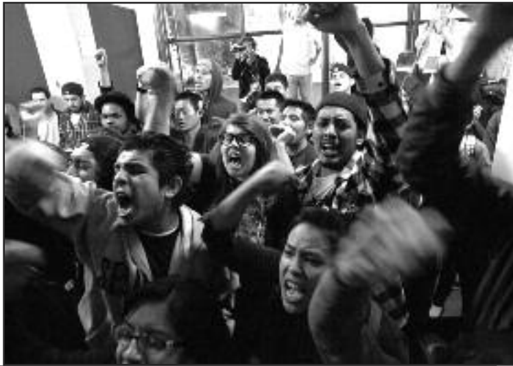
Estudiantes de la Universidad de Santa Monica, CA.

profesor habló del “valor de la educación pública para una nación próspera y democrática”, añadiendo, que “necesitamos encontrar las mejores ideas para enfrentar esta crisis y fortalecer nuestro sistema.”