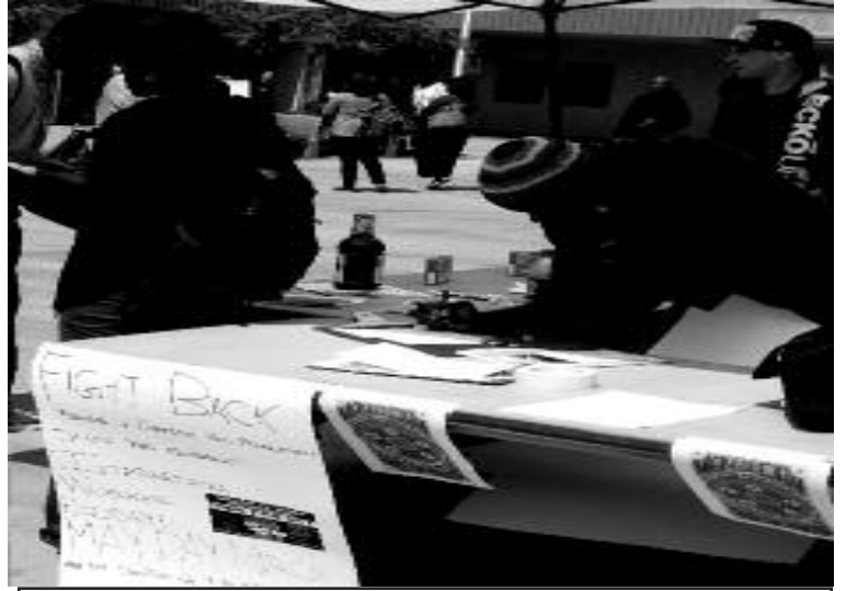
27de marzo--Estudiantes firman carta de apoyo a familias de victimas de asesinatos racistas y tomando copias de Bandera Roja y calcamionias del 1º de mayo

El estibador leyó en voz alta una carta a Bandera Roja de un trabajador de Boeing acerca de la lucha en la planta en torno a Trayvon Martin. Describe en parte como movilizaríamos a las