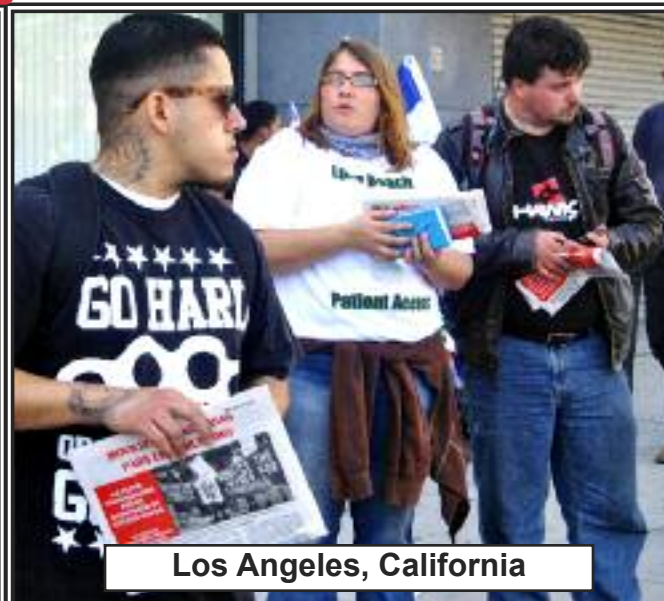
Los Angeles, California