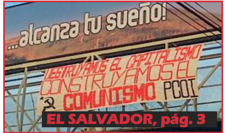
EL SALVADOR, pág. 3