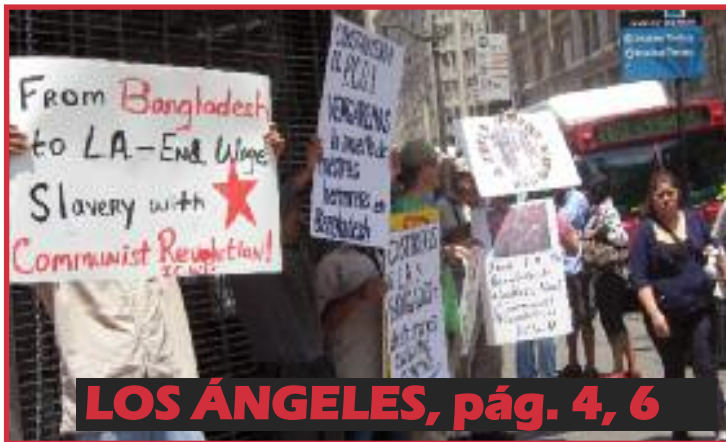
LOS ÁNGELES, pág. 4, 6