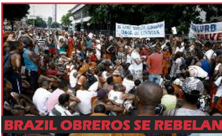
BRAZIL OBREROS SE REBELAN