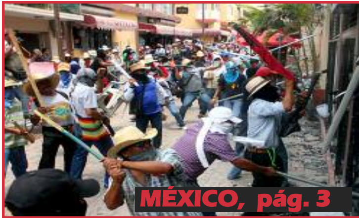
MÉXICO, pág. 3