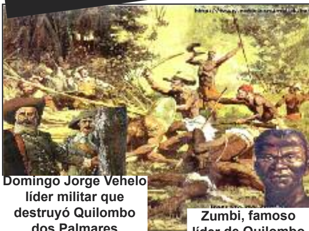
Domingo Jorge Vehelo líder militar que destruyó Quilombo dos Palmares

QUILOMBO UNA HISTORIA DE LUCHA QUE MUESTRA QUE COMUNISMO ES POSIBLE