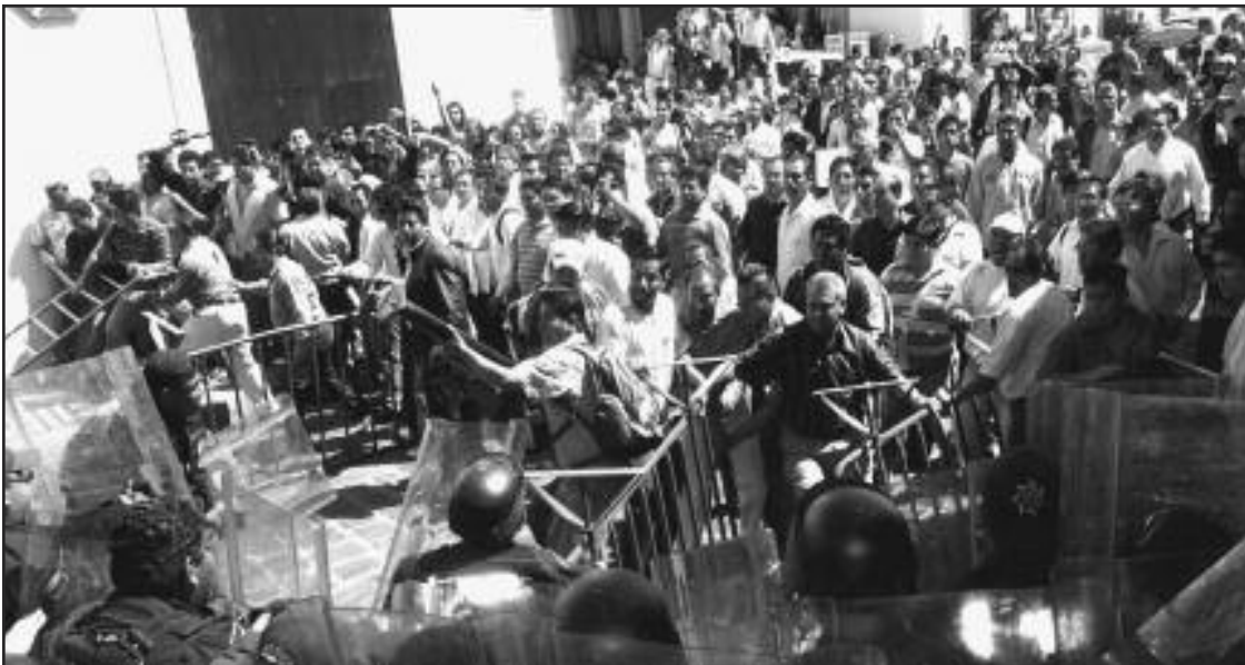
Oaxaca, Marzo, 2011--Maestros, trabajadores y estudiantes batallan contra la policia que protegía al presidente Felipe Calderon.

México— 23 de mayo—Miles de maestros de la sección 22 del Sindicato Nacional de Trabajadores de la Educación (SNTE), iniciaron un paro indefinido, tomándose mediante un plantón el zócalo oaxaqueño, para demandar al gobierno federal y estatal la reinstalación de la mesa de diálogo. Al mismo tiempo