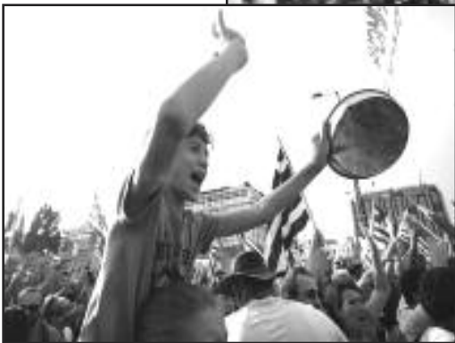
Atenas, Grecia, 5 de junio del 2011--Ochenta mil trabajadores y estudiantes protestan programas de austeridad impuestos por Eurozone y FMI. Ver página 6.