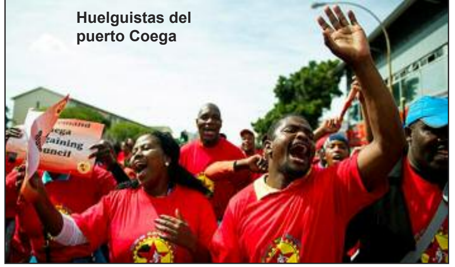
Huelguistas del puerto Coega

En resumen, nosotros, como miembros del PCOI, tuvimos exitosamente una cena de dos días, abril 12 y 13, una conferencia y eventos en el 1° de Mayo, a pesar de que la celebración oficial del 1° de Mayo fue monopolizada por los nacionalistas y la convirtieron en una pésima actividad electorera.