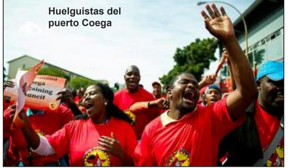
Huelguistas del puerto Coega

En resumen, nosotros, como miembros del PCOI, tuvimos exitosamente una cena de dos días, abril 12 y 13, una conferencia y eventos en el 1° de Mayo, a pesar de que la celebración oficial del 1° de Mayo fue monopolizada por los nacionalistas y la convirtieron en una pésima actividad electorera.