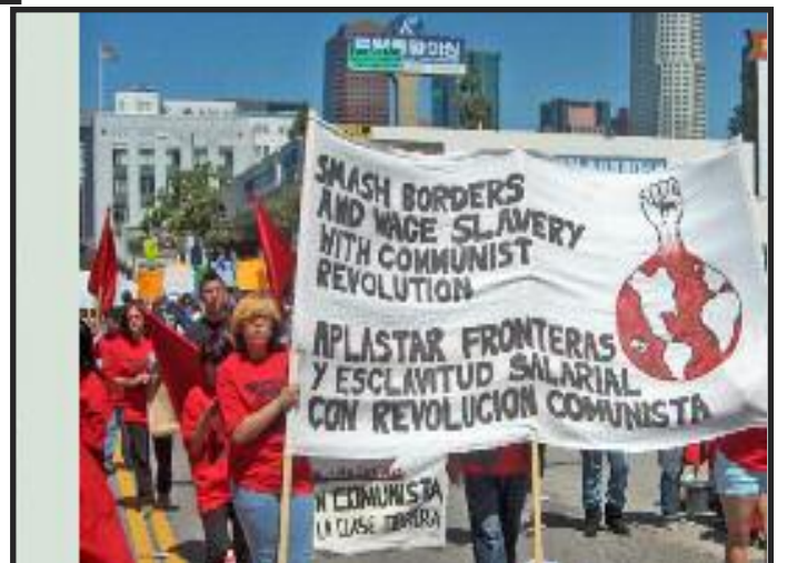
Este ya tiene 20 años como presidente general. Chofer de MTA