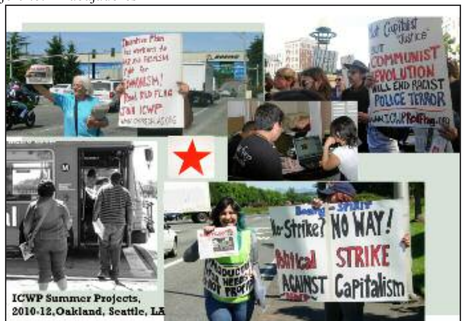
ICWP Summer Projects, 2010-12, Oakland, Seattle, LA

Invitamos a los trabajadores, soldados, maestros y estudiantes por todo el mundo a organizar proyectos de verano similares para que de esta manera avancemos la lucha para emancipar a la clase trabajadora internacional de la explotación capitalista y construir el estado obrero. ¡Que viva el comunismo! ¡Únete al PCOI!