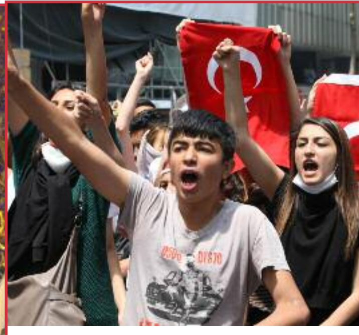
Turquía (jóvenes se manifiestan) Las masas en Brazil se lanzan a la calle a protestar contra el capitalismo. (Ver artículos página 2)