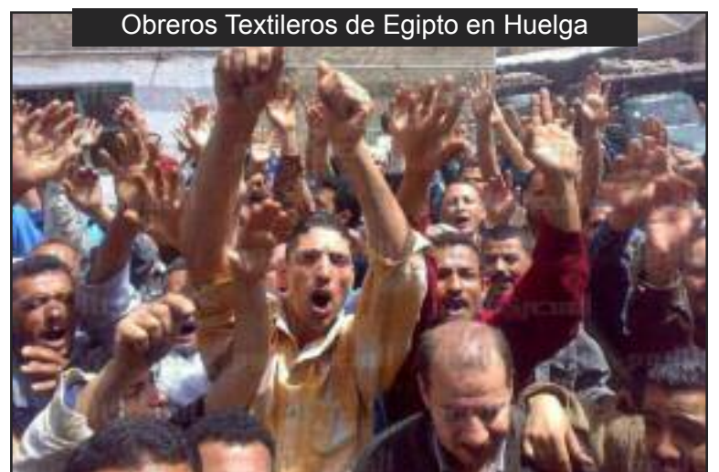
Obreros Textileros de Egipto en Huelga

Como la situación egipcia muestra claramente, es muy importante ganar los soldados rasos, en Egipto, los EE.UU., y en todas partes, a aliarse con los obreros industriales y la juventud. Ellos