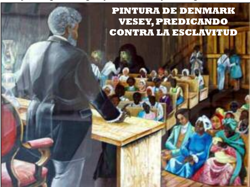
PINTURA DE DENMARK VESEY, PREDICANDO CONTRA LA ESCLAVITUD