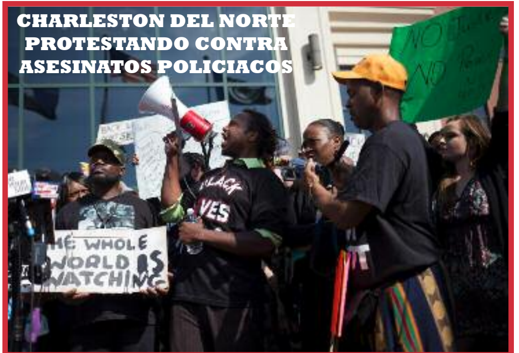
CHARLESTON DEL NORTE PROTESTANDO CONTRA ASESINATOS POLICIACOS

Los Patrones quieren Super-Explotar a los Janitors por Igual: