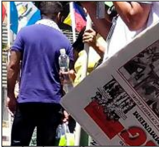
Los Angeles--Manifestantes en protestas contra el Genocidio en Gaza y deportaciones de niños inmigrantes tomaron con entusiasmo Bandera Roja

Los trabajadores tendremos zonas comunistas donde el comunismo estará funcionando para su avance en el mundo entero, donde todos serán bienvenidos. Luchemos por un mundo comunista sin fronteras, ni dinero y sin patrones. Únete al PCOI.