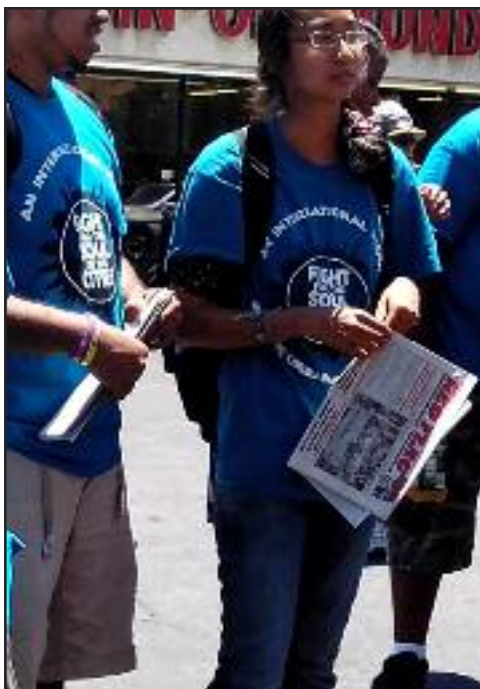
Manifestantes en Los Angeles y Tel Aviv en contra de masacre

Estos jóvenes soldados, como los soldados en todas partes, pueden ser ganados a convertir su odio a la racista opresión capitalista en dedicación a la lucha por el comunismo. La oportunidad exige urgencia - urgencia para distribuir Bandera Roja masivamente en integrarse al PCOI y construirlo mundialmente para movilizar a las masas obreras, soldados y estudiantes para destruir el capitalismo-imperialismo de una vez por todas.