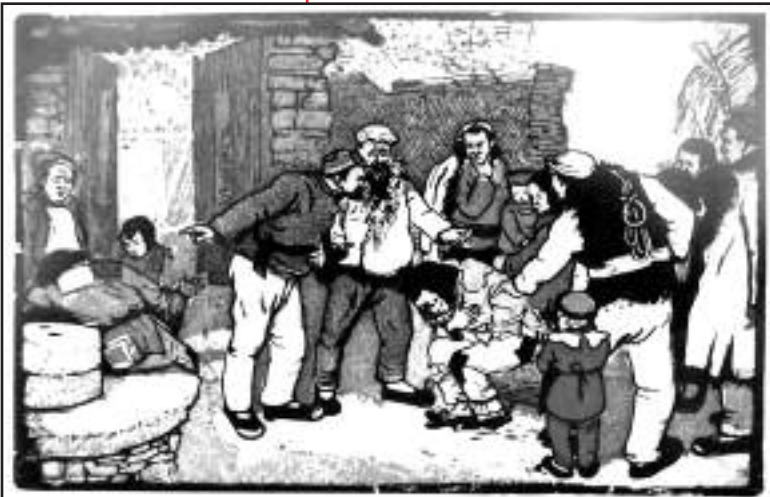
Trabajadores chinos, cortadores de madera, en una sociedad comunista luchando con alguien que no quiere trabajar, para que sea parte de la colectiva.

El desacuerdo más grande, sin embargo, que tenemos es la cuestión de leyes. Algunos de nosotros pensamos que nuestra clase gobernará la sociedad basada