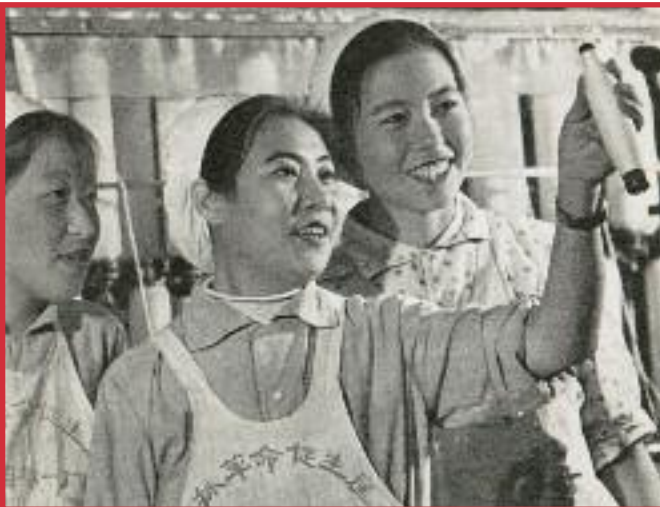
Wu Kuel-hsien, una obrera de una hiladora se hizo vice-primer ministro de China.

Hoy el Partido Comunista Obrero Internacional (PCOI) tiene una idea muy diferente.