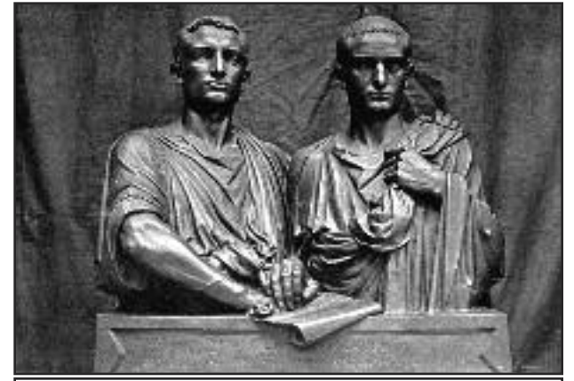
Tiberius y Gaius Gracchus

Gaius intentó extender la ciudadanía romana (incluyendo el voto) a la gente libre afuera de Roma. Esto lo puso en conflicto con los que antes lo apoyaban. Después, Gaius fue obligado a suicidarse. Algunos historiadores consideran que la muerte de los Gracchus fue el comienzo del fin