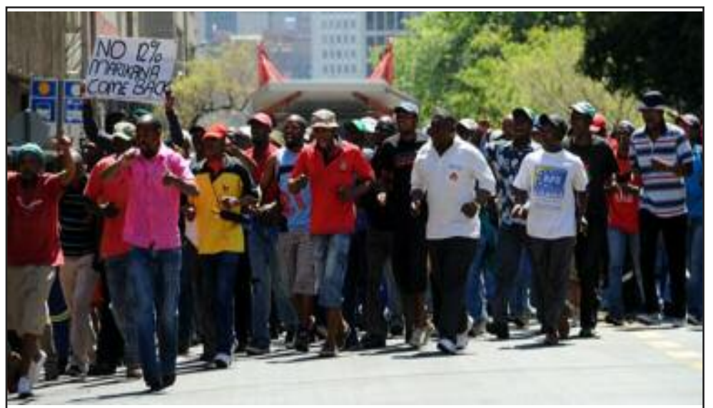
Choferes sudáfricanos en huelga, octubre del 2012