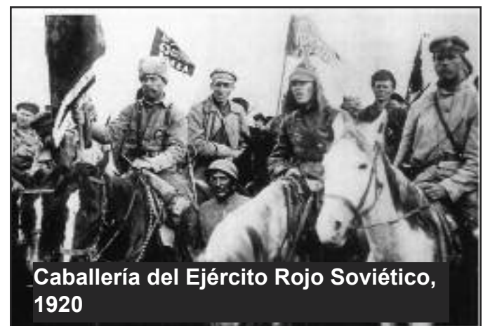
Caballería del Ejército Rojo Soviético, 1920

Es una historia diferente cuando se acurrucan detrás de las puertas cerradas de sus grupos de expertos militares imperialistas. Stephen Biddle, llamado el mejor analista de defensa estadounidense de su generación, se preocupa.