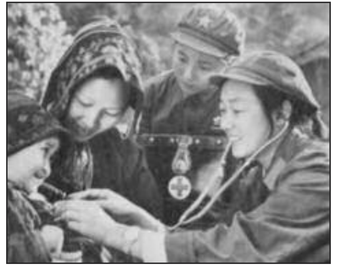
Médicos Descalzos en China, década de 1960

2. Movilizar a las masas para la prevención. La experiencia china muestra que incluso las personas sin conocimientos médicos pueden contribuir grandemente a la prevención. Así fue como acabaron con enfermedades graves y llevaron la asistencia médica a las zonas rurales. La prevención incluye comida nutritiva, agua potable, y siste-