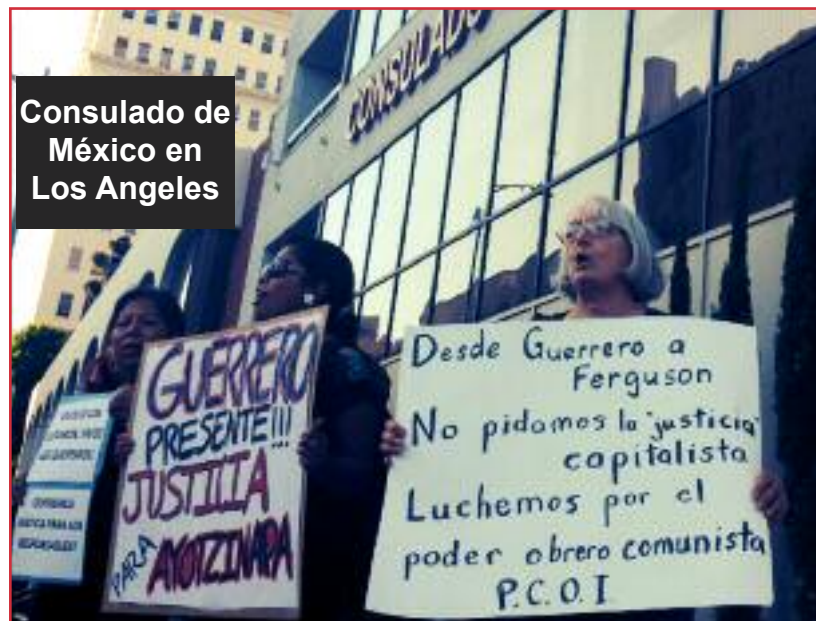
Consulado de México en Los Angeles

Mexico - Tomando radio emisoras, bancos y quemando la alcaldia y palacio de gobierno en Chilpancingo, Guerrero, estudiantes y maestros protestan combativa y masivamente.