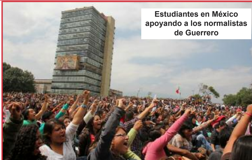
Estudiantes en México apoyando a los normalistas de Guerrero