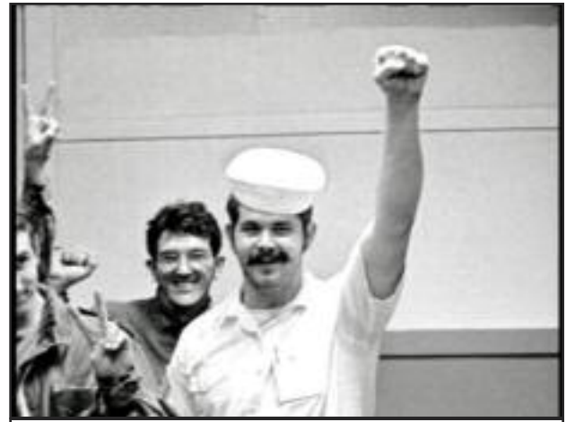
Desde el motin en el Potemkin-Rusia 1905 al USS Kitty Hawk de EE.UU durante la guerra de Vietnam los marineros han jugado un papel importante en la lucha de clases.

Somos trabajadores y nuestras familias y amigos son trabajadores. Tenemos que protegernos de las amenazas de los capitalistas, nacionales y extranjeros. Eso significa unirnos con marineros