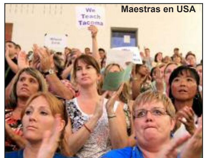
Maestras en USA

La CNTE acordó el seis de octubre regresar a las aulas, sin éxito. La profesora tuvo que regre-