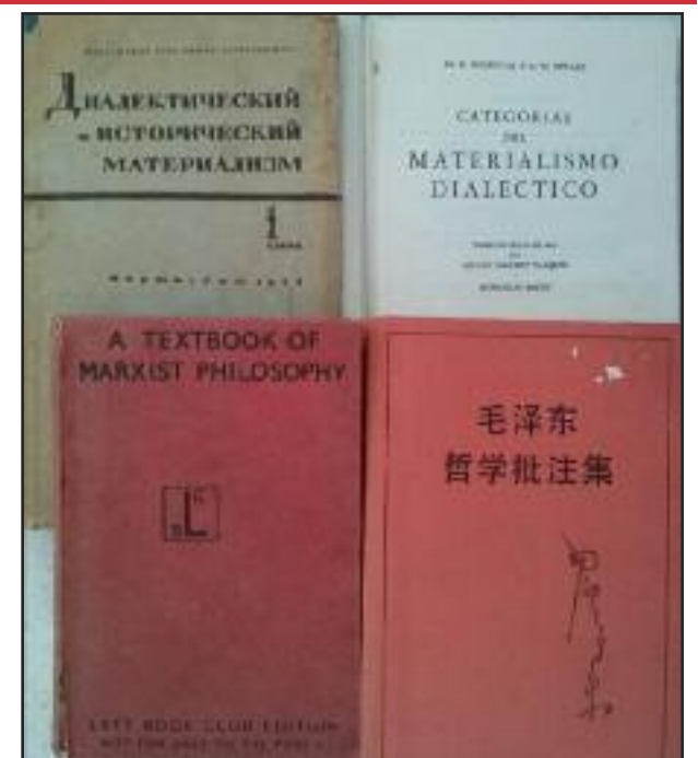
La propagación de la dialéctica: 1933 texto soviético, 1937 texto Inglés, 1950 texto español, 1950 Notas de Mao Zedong sobre los textos soviéticos.

La historia real de la URSS y China mostró que esta posición es fundamentalmente errónea. En la URSS, las contradicciones existentes entre-