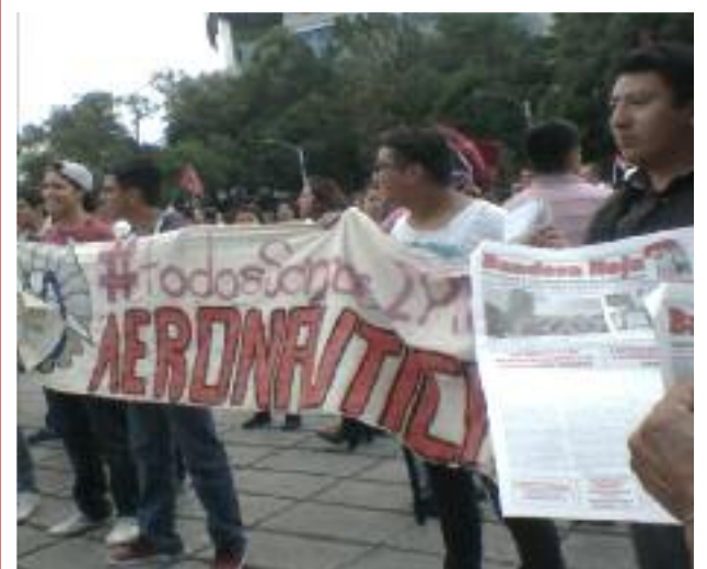
Estudiantes del Politécnico en México D.F.

SUDÁFRICA: CONFERENCIA COMUNISTA ABRE OJOS Y POSIBILIDADES PÁGINA 2, 3 Y 7