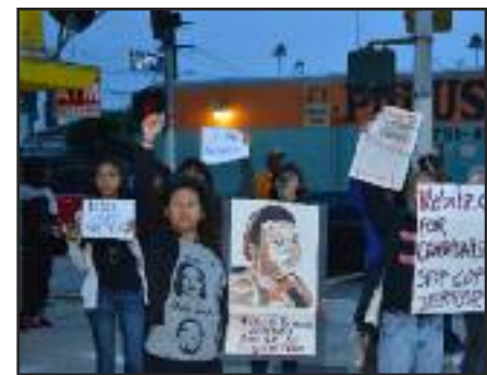
Protesta contra asesinatos Policiacos, en Los Ángeles, CA.

No podemos dejar de luchar ni por un minuto. ¡Hacia el Primero de Mayo y más allá!