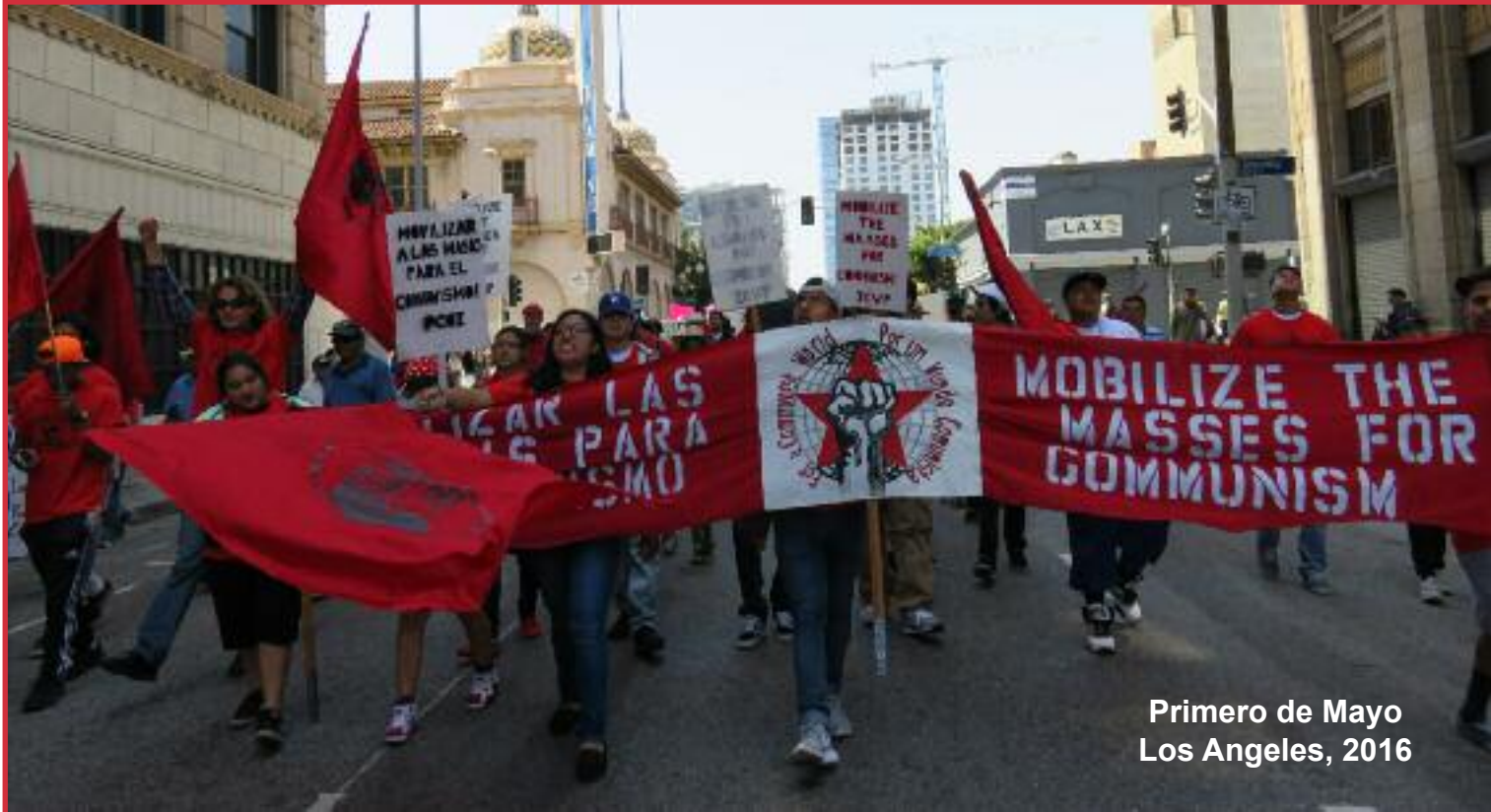
Primero de Mayo Los Angeles, 2016

PARTIDO COMUNISTA OBRERO INTERNACIONAL * WWW.ICWPREDFLAG.ORG