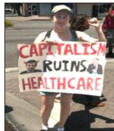
Capitalismo Arruina el Cuidado de la Salud

SOUTH GATE, EE.UU., 23 julio— Alrededor de la mitad de los manifestantes en este mitin por un sistema de salud nacional tomó Bandera Roja , incluyendo a la joven en la foto con el cartel. A medida que el ataque a la atención de la salud se agudizó en las últimas dos semanas, los trabajadores/as han salido a las calles en marchas y manifestaciones por todo el país. Miembros del PCOI y amigos han llevado las ideas comunistas a estos eventos. Sólo el comunismo -basado en satisfacer las necesidades humanas, no en ganancias - puede cuidar la salud de la clase obrera.