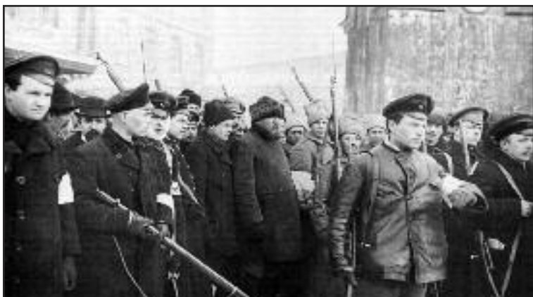
Obreros armados defendiendo la Revolución de Octubre(1917).

La revolución por reformas no creó y no pudo crear la sociedad comunista realmente necesitada por los trabajadores de entonces y ahora. Hemos aprendido esta gran lección de la revolución bolchevique: nuestro programa ahora y siempre debe ser movilizar a las masas directamente para el comunismo.