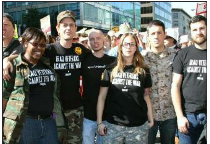
Veteranos de USA en contra de la guerra en Irak se movilizan en contra de futuras guerras imperialistas.

Ahora es el momento de intensificar nuestro actuar. Ahora es el momento de ingresar y construir el Partido Comunista Obrero Internacional.