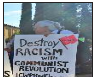
Destruir el Racismo con la Revolución Comunista

La lucha por el comunismo requiere un Ejército Rojo de trabajadores comunistas, soldados y jóvenes y un PCOI masivo para liderarla. ¡Únete a la pelea! Lee, distribuye y escribe para Bandera Roja . Organiza un colectivo del PCOI en tu trabajo, vecindario o unidad militar.