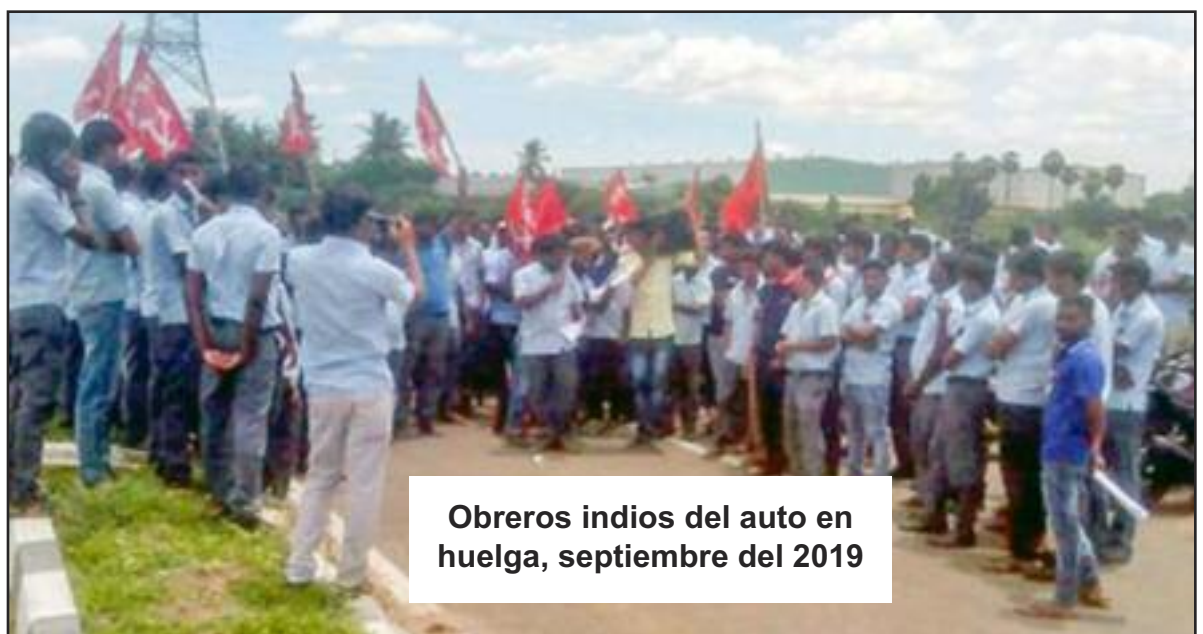
Obreros indios del auto en huelga, septiembre del 2019

mingo vamos a tener una reunión en mi casa. Hemos invitado a todos los vecinos. Podemos tener 100 o más personas. Explicaremos cómo construir una sociedad sin dinero y cómo esta sociedad comunista eliminará las fronteras, las “razas” y las naciones. En la sociedad comunista aprenderemos a crear y compartir todo lo que producimos.