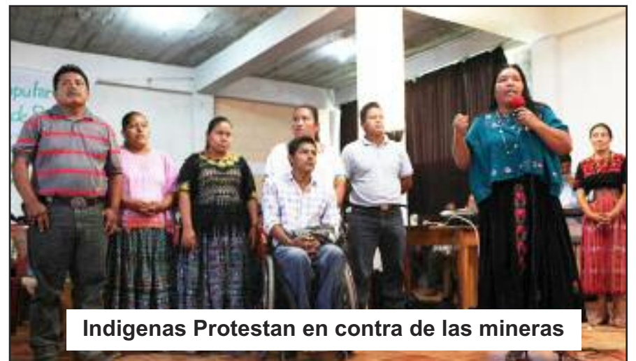
Indigenas Protestan en contra de las mineras

Organicemos en Guatemala y alrededor del mundo la Revolución Comunista, como están haciendo los trabajadores en Sudáfrica, El Salvador, México, Puerto Rico, India, y muchos países donde Bandera Roja a llegado y donde el Capitalismo aun esta masacrando a la clase trabajadora. Organicemos