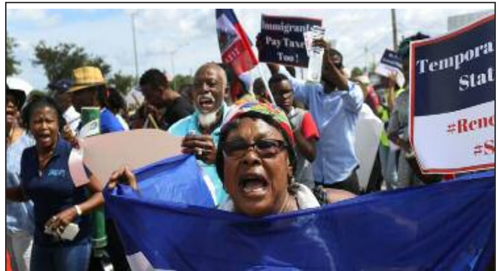
Haitianos se manifiestan en Washington D.C. en febrero del 2019 en contra de la terminación del Estatus de Protección Temporal (TPS).

Los trabajadores han construido todo en los Estados Unidos y en todo el mundo. A los patrones les gustaría que pensemos que no podemos funcionar sin su "experiencia", cuando todo lo contrario es cierto. Solo la clase trabajadora puede satisfacer las necesidades de nuestra clase. La clase trabajadora internacional tiene el conocimiento y las habilidades para tener aire limpio y llevar alimentos, agua y una excelente atención médica a todas partes del mundo.