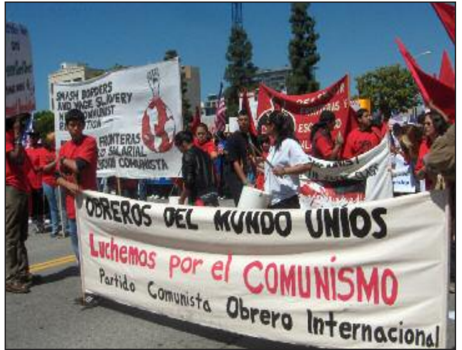
Los Angeles, USA —1 o de Mayo 2010

“Hoy queremos que todos ustedes nos ayuden a analizar nuestro trabajo político en las concentraciones industriales y concentraciones de