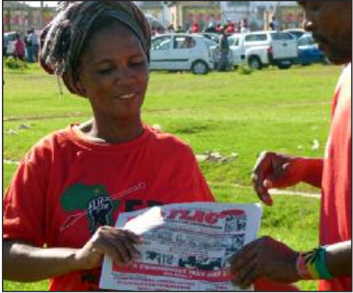
REPARTIENDO BANDERA ROJA EN SUDÁFRICA

Hay esperanza para el comunismo. La gente está comenzando a reconocer los defectos del capitalismo. Y como comunistas necesitamos aprovechar esas oportunidades para ganarlos a nuestro lado. ¡Adelante con el comunismo!