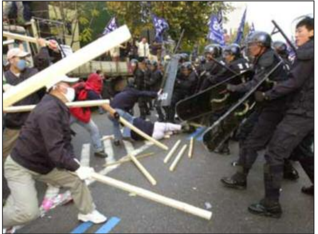
Los Trabajadores en Corea del Sur tienen una historia de lucha de clases militantes. En la foto de arriba, en el centro de Seúl, obreros automotrices se enfrentan a policías anti-motines durante una protesta en contra del gobierno en 2003,

Por o tanto, decimos ¡¡¡NO MÁS !!! ¡Es hora de reunir a los trabajadores del mundo para movilizarse para el comunismo! Bajo el comunismo, no habrá Parks ni Donald Trumps porque todos compartiremos el trabajo para crear y mantener una sociedad más equitativa. Deja de dejar que las élites te engañen para que odies a tu compañero de trabajo y únete a nosotros para finalmente ponerle fin al capitalismo.