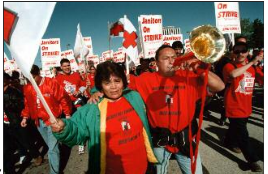
Trabajadores, indígenas Mayas, en huelga junto con “Justicia para los Janitors” en Los Angeles, USA

En todos los casos me ha dado la oportunidad de explicar como es el racismo y como trabaja para tener a la clase trabajadora peleándose entre si, para beneficio de los patrones. También me ha dado la oportunidad de presentarme como comunista con algunos que