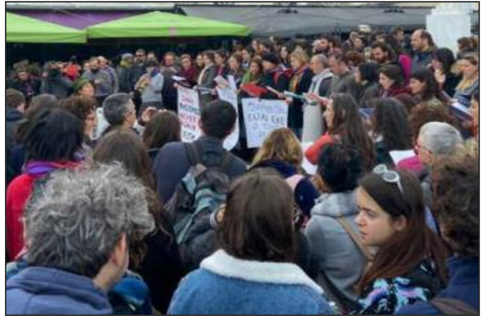
7 de marzo, protesta en apoyo de los refugiados en la Plaza de Sappho en Mytilene, Lesbos, con pancartas que dicen, "Nunca Más".

Ningún capitalista — sea de EE.UU., Rusia, Turquía, Siria o la Unión Europea — se preocupa por las vidas de nuestra clase. La respuesta de las masas antifascistas de Europa tiene en sí las semillas del movimiento que necesitamos. Pero para crear un mundo donde ningún trabajador sea considerado extranjero, debemos ir más allá de las peleas con fascistas y marchas en las calles. Debemos construir las fuerzas necesarias para luchar por un mundo comunista, ¡sin capitalistas ni fronteras! ¡Trabajadores del mundo, úniós!