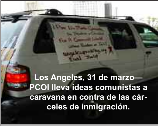
Los Angeles, 31 de marzo— PCOI lleva ideas comunistas a caravana en contra de las cárceles de inmigración.