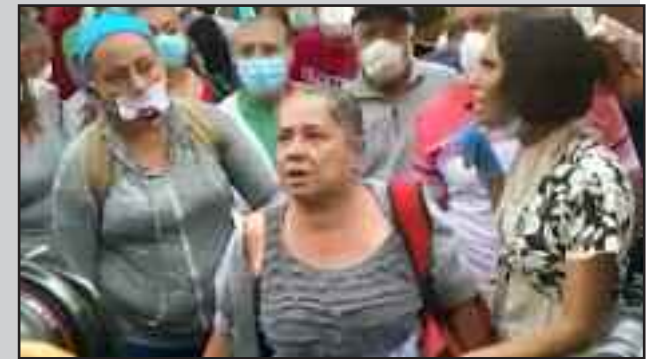
Miles de trabajadores se concentraron frente a los edificios del gobierno demandando sus $300 dólares. El Salvador ha estado en cuarentena desde hace 2 semanas.

Lee y comparte nuestro periodico Bandera Roja , al mundo entero.