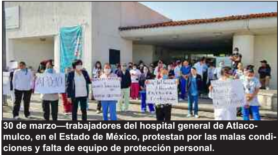
30 de marzo—trabajadores del hospital general de Atlacomulco, en el Estado de México, protestan por las malas condiciones y falta de equipo de protección personal.

Ya han cambiado los límites del debate político. ¡De esta lucha es donde vendrán los futuros líderes de nuestra revolución comunista!