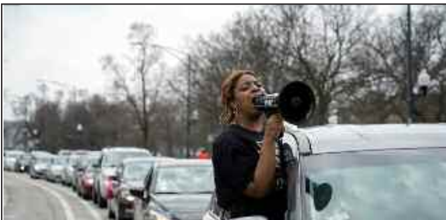
Chicago, EE.UU. Caravana de solidaridad con los prisioneros del Condado Cook, pidiendo que los liberen debido a que es uno de los lugares de mayor contaminación. del Covid-19.

Trabajadora del hospital en Chicago, EE. UU.