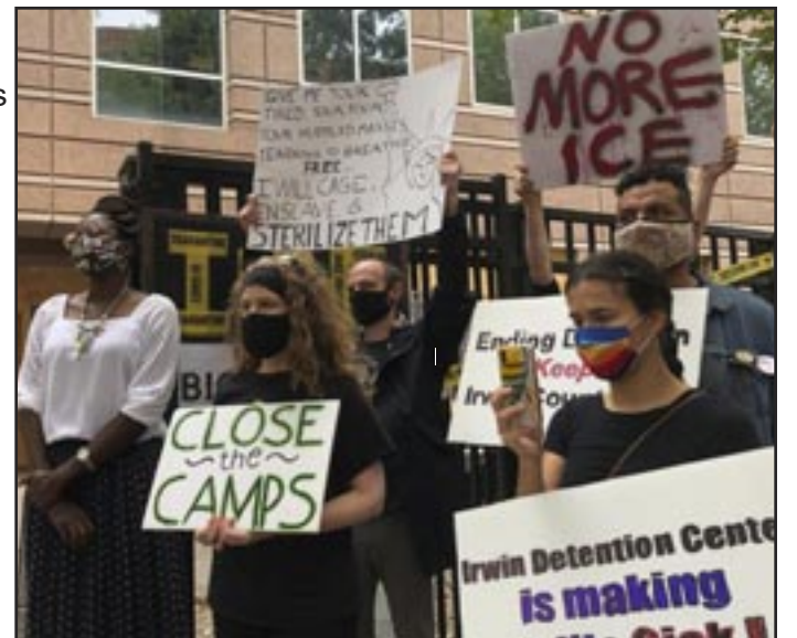
Georgia, EE.UU. —