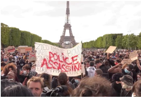
Protesta masiva multirracial en Francia contra los asesinatos racistas de la policía, junio de 2020

La cantidad de estos delitos es grande. Esta vez, hemos visto un cambio cualitativo, de los movimientos de protesta locales a la indignación global. El gran número de personas no negras en las protestas también es un cambio cualitativo. El cambio en la cantidad se convierte en un cambio de calidad, y produce una nueva situación de expresión masiva y multirracial de odio hacia la policía y sus jefes capitalistas. Esto es un paso más hacia la comprensión de las masas del racismo como opresión organizada mantenida por los capitalistas para imponer su dominio sobre la clase obrera.